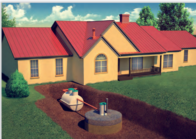
EKO-BIO, Oczyszczalnia biologiczna ze studnią chłonną. Stosowana na małych działkach przy gruntach dobrze przepuszczalnych, z niskim poziomem wód gruntowych (zajmuje niecałe 16 m 2 ). Sprawdza się również w ciężkim, nieprzepuszczalnym gruncie (gliny, iły) z wodą gruntową w przedziale 2,5 do 5,0 metrów. Oczywiście jako opcję można zastosować dodatkowy zbiornik na wodę do podlewania. Wówczas tylko nadmiar niewykorzystanej wody (i całość zimą) trafią do studni chłonnej.