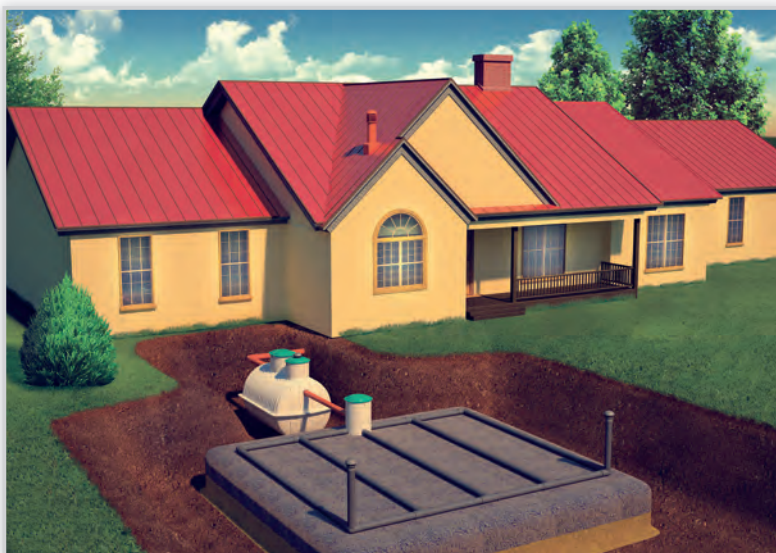
EKO-BIO, Klasyczna oczyszczalnia ekologiczna. Osadnik gnilny z odbiornikiem gruntowym (poprzez drenaż). Znakomita alternatywa wobec szczelnego szamba dla dobrze przepuszczalnych gruntów i niskiego poziomu wód gruntowych. Sprawdza się również w domkach letniskowych (obiektach używanych okresowo, sezonowo). Wymaga wprawdzie około 50 m 2 powierzchni ale do pracy nie potrzebuje prądu i prawidłowo eksploatowana zapewni satysfakcję przez kilka dziesięcioleci pracy.