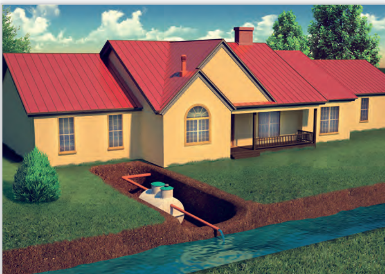
EKO-BIO, Biologiczna przydomowa oczyszczalnia ścieków z odprowadzeniem do rowu melioracyjnego/cieku wodnego. Rozwiązanie idealne dla małych działek, gruntów trudno przepuszczalnych i wysokiego poziomu wód gruntowych. Oferuje bardzo wysoką redukcję zanieczyszczeń, jest urządzeniem trwałym, energooszczędnym, nie wymagającym skomplikowanych czynności serwisowych.